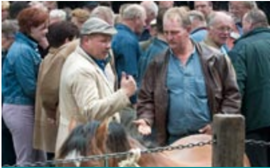
'De eerste klap is een daalder waard'

De geschiedenis van het Geld- en Bankmuseum begint in januari 1994. Toen nam de Tweede Kamer bij de verzelfstandiging van 's Rijks Munt een motie aan waarin werd gepleit voor het samengaan van de museale en voorlichtingsactiviteiten van Rijksmuseum Het Koninklijk Penningkabinet (KPK), van Het Nederlands Muntmuseum (HNM) en die van de Nederlandsche Bank (DNB)