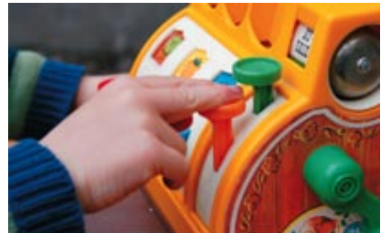
'Jong geld bestormt de Quote 500'

Een andere taak van de projectgroep Gebouw in 2004 was het schrijven van een calamiteitenplan. Bij de opening van het museum voor het publiek in 2006 moet dit plan klaar en operationeel zijn. Wegens de bijzondere situatie als gevolg van de verbouwing was het museum verplicht om ook een voorlopig calamiteitenplan te maken.