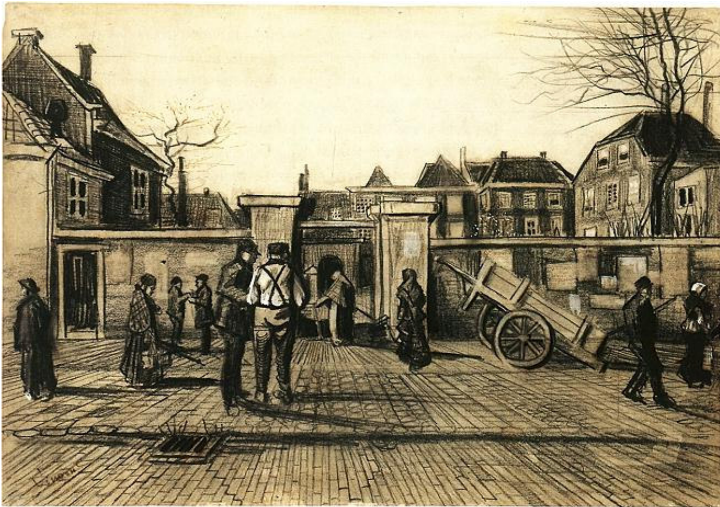
Vincent van Gogh, De Bank van Lening (Amsterdam, Van Gogh Museum)