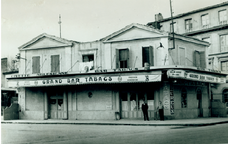
Het Gele Huis in Arles

Boven op die toelage bekostigde Theo ook nog eens een belangrijk deel van de verf en het schildersdoek. Uit de brieven valt af te leiden dat de afspraak tussen de broers was dat Vincent elke week 50 francs zou ontvangen. De vijf maal gestuurde 100 francs tijdens Gauguins verblijf hangen samen met diens aanwezigheid in Arles; en dat Theo eerder enkele keren 100 francs stuurde, is te verklaren uit het feit dat Vincent schreef om geld verlegen te zitten, of zelfs geheel blut te zijn. Voor alle duidelijkheid: de reden dat Van Gogh vaak in geldnood was, kwam niet omdat hij zo weinig kreeg, maar omdat hij zijn geld over het algemeen veel te enthousiast uitgaf.