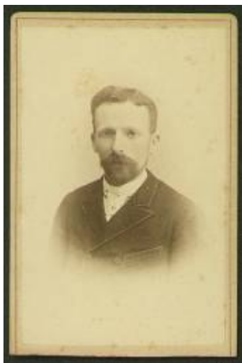
Theo van Gogh, 1887

Ik hoop U vanmiddag iets meer zicht te bieden op het wel en wee van Van Goghs portemonnee, waarvan de bodem maar al te vaak in zicht was. In het citaat dat U op de uitnodiging vond, stelde hij 'Toch durf ik te hopen dat het geld dat we uitgeven, op een dag gedeeltelijk zal terugkeren, en als ik meer geld had, zou ik nog meer uitgeven om te proberen een heel rijk koloriet te maken.' Dit schreef hij aan zijn broer Theo in juli 1888 vanuit Arles, toen hij met schilderen uitermate goed op dreef was.