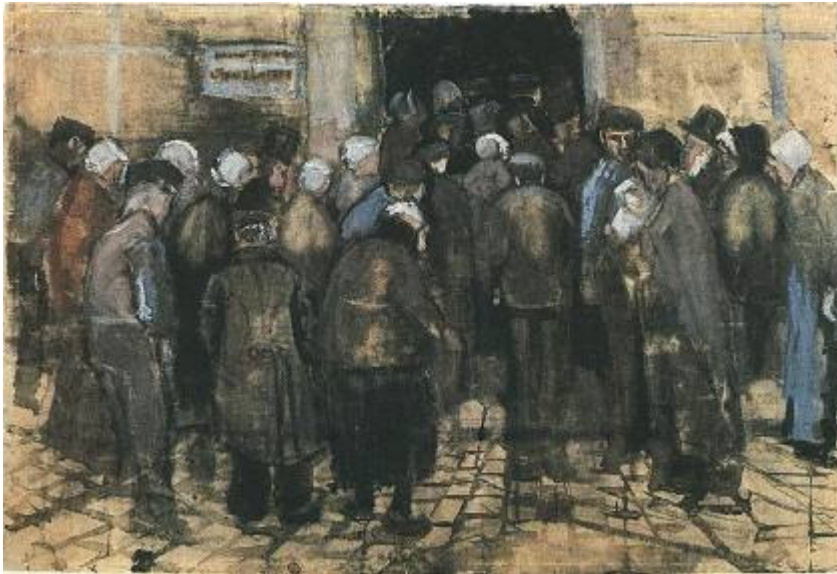
Vincent van Gogh, De armen en het geld , 1882 (Amsterdam, Van Gogh Museum)

We zien een groep mensen die bij een kantoor van de staatsloterij de uitslag komt vernemen, getuige het aanplakbiljet links dat vermeldt 'heden Trekking Staatsloterij'. De scène speelt zich af voor het loterijkantoor van de gebroeders Mooijman. De armoedigheid van het merendeel van de wachtenden had Van Gogh getroffen en het tafereel kreeg voor hem een diepere betekenis: 'Dan wordt het dunkt mij meer beteekenisvol als men er in ziet – de armen en het geld. Zoo is 't trouwens met haast alle figuurgroepen, men moet er wel eens over doordenken eer men inziet waar men voor staat – de nieuwsgierigheid en illusie over de loterij schijnt ons min of meer kinderachtig – maar het wordt ernstig als men denkt aan de oppositie van misère en dat soort van efforts de perdis van de stakkers om door een loterijbriefje te nemen, betaald met hun uit den mond gespaarde centen, mogelijk, zooals zij zich verbeelden, gered te worden'. In deze fase van zijn kunstenaarschap zocht Van Gogh naar eigentijdse, sociaal-realistische onderwerpen. Hij was toen nog van plan om tijdschriftillustrator te worden.