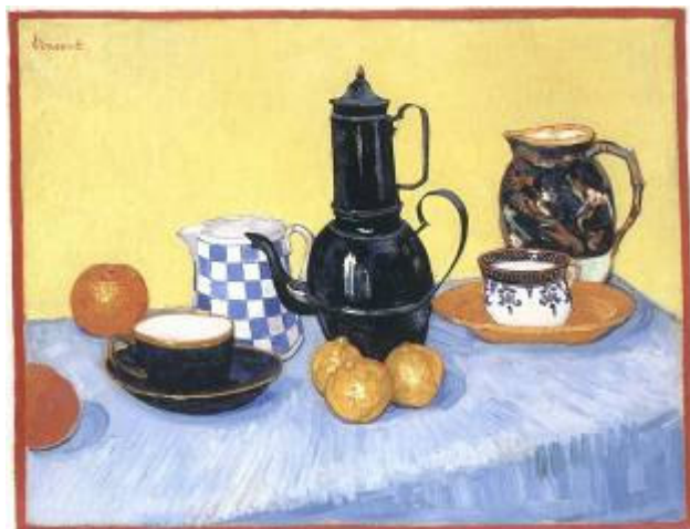
Vincent van Gogh, Stilleven met blauwe koffiekkan , 1888 (Patriculiere collectie)

In Arles worden die toelagen flink opgeschroefd. Theo geloofde in het werk van zijn broer en was overtuigd van de kracht van de Zuid-Franse tekeningen en schilderijen die hij kreeg toegestuurd, – daar zitten ook prachtwerken tussen – evenals van de plannen die zijn broer had met het Gele Huis.